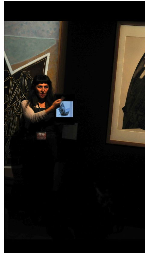
Ci-dessus photo de NikonLeMat

https://museepauldupuy.toulouse.fr/exposition-henri-georges-adam-un-moderne-revele/